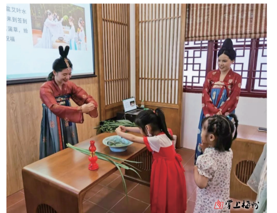
梅江區博物館開展“迎端午 承傳統”主題活動。

專業優勢,深入村居,開展了多種多樣的“端午”主題活動,與留守兒童和空巢、困境老人共度端午節。羅基村社工服務點、古基村社工服務點和代富村社工服務點聯合村委會發動困難、留守老人積極開展了包粽子、送粽子、吃粽子的端午活動,陂村社工服務點和三崗社工服務點組織居民開展了制作端午掛飾和香囊的DIY手工活動。(梅州日報記者:劉曉娟 吳麗伶 林玉榮 梁蕊)