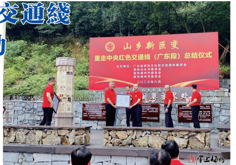
振興建設發生的新變化、取得的新成就,以更加擔當作為的狀態奮進新時代新徵程。

在梅期間,考察團將通過實地考察的方式,走進大埔縣西河鎮、茶陽鎮、青溪鎮等地,沿着革命先烈的足跡,深入挖掘中央紅色交通綫上的歷史事件、革命英雄、革命精神和革命遺存,講好紅色故事,廣續紅色血脈;引導社會各界深刻感受紅色交通綫沿綫廣大鄉村鞏固拓展脫貧攻堅成果、推進鄉村